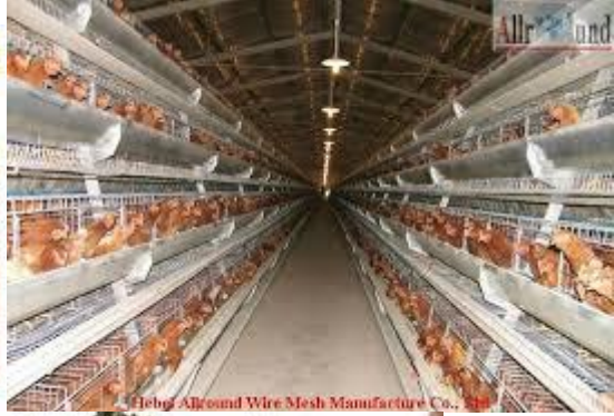
Hebu Allround Wire Mesh Manufacture Co., Ltd