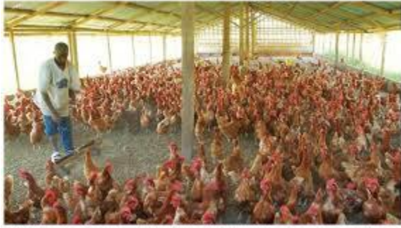
Mogot akwabadomde baba akabi, hamba litapasa hamba ka nafas na akweto era Kiribaku masanga ka baba ya bamba.